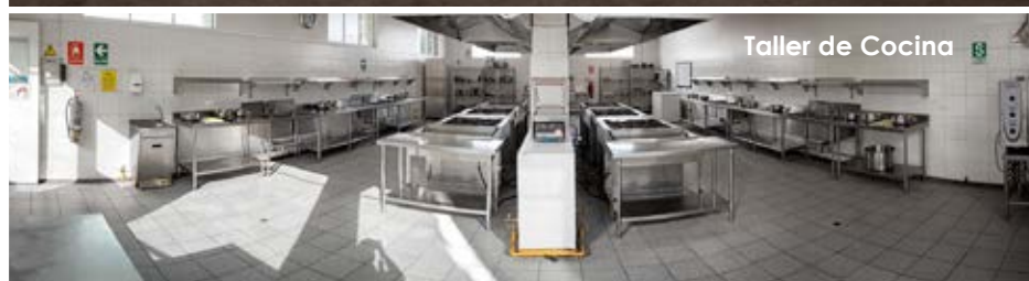
Taller de Cocina