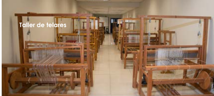
Taller de telares