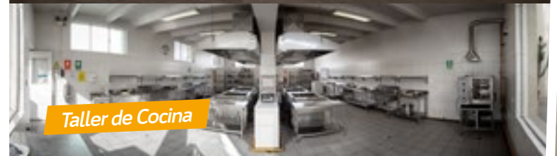
Taller de Cocina