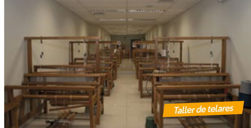
Taller de telares

En todos los ambientes de nuestro campus para que estés siempre conectado y puedas acceder a la información necesaria para complementar tus estudios.